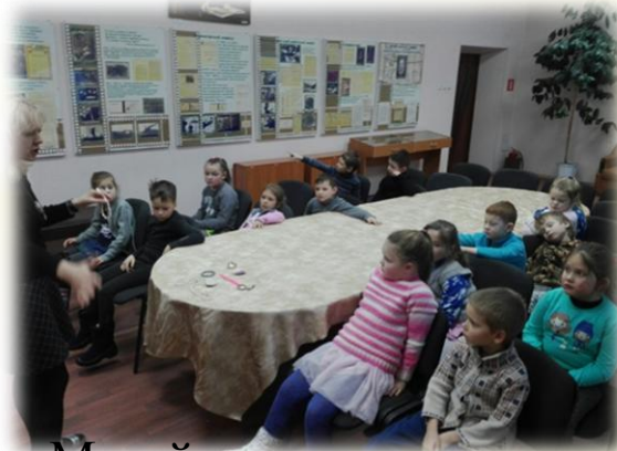
Музей цветного камня имени В.Н. Дава