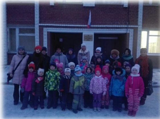
Детская музыкальная школа им. М. М. Сакадынца